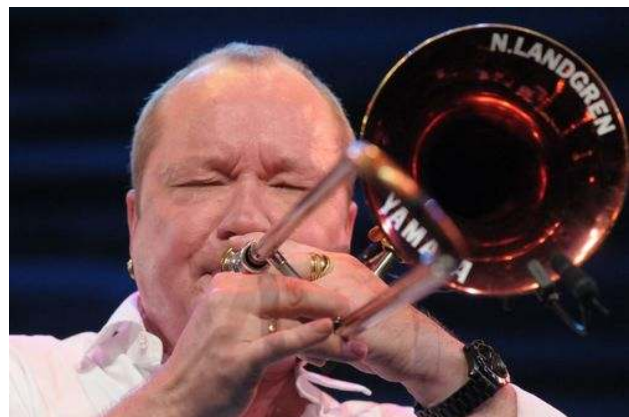
Nils Landgren - the Man with the Red Horn!

Die Noten für den Workshop und das Mitmachkonzert können unter www.landesmusikrat-sh.de heruntergeladen werden.